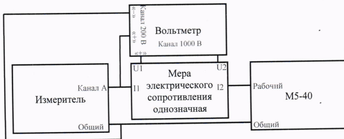
Рисунок 3 – Схема измерений относительной погрешности установки сопротивления