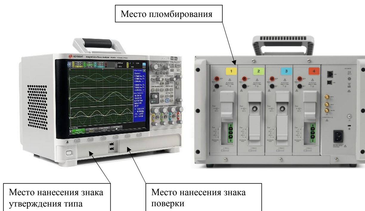
Рисунок 2 - Общий вид анализаторов PA2203A